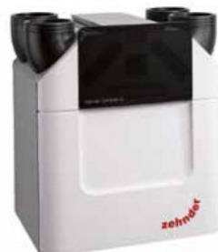
Inteligentní větrací jednotka ComfoAir Q350 TR (Zehnder), účinný a tichý provoz, vybavena výměníkem tepla ve tvaru diamantu s větším povrchem pro účinnější rekuperaci tepla, www.zehnder.cz