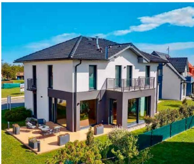
Rodinný dům Residence s dispozicí 7+1, betonová konstrukce s inteligentním zateplovacím systémem, cena od 7 899 000 Kč , www.canaba.cz

Akumulační nádrž NADO 300/20 (DZD) včetně izolace ke shromažďování přebytečného tepla od zdroje – solárních panelů, nádrž obsahuje vnořený nerezový výměník pro přípravu teplé vody, www.dzd.cz