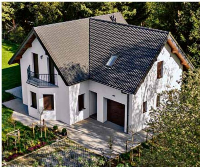
Pasivní dům N14 s dispozicí 5+1+G, součástí provedení „Zelená úsporám“ je tepelné čerpadlo a inteligentní domácnost, cena 3 850 000 Kč, www.ekonomicke-stavby.cz