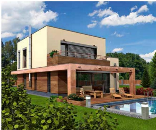
Rodinný pasivní dům MAPLE 20 s měrnou potřebou tepla na vytápění 17 kWh/m 2 díky stavebnímu systému VELOX, zastavěná plocha 103,16 m 2 , cena stavebnice 1 349 500 Kč , www.hoffmann.cz

Když se řekne pasivní dům, možná si představíte futuristickou stavbu se solárními panely a cenovkou, která vás donutí zhluboka dýchat do papírového sáčku. Klid...