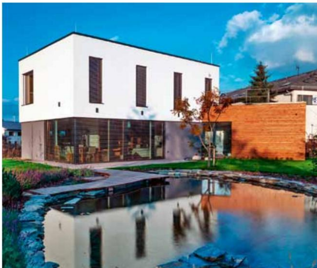
Dvoupodlažní zděná monolitická stavba pasivního domu, projekt Cholupice , k základní hmotě stavby je nasunuta jednopodlažní část s relaxací a wellness, www.kubus.cz

Tepelné čerpadlo R290 Monobloc (LG), jeden z nejtíšších modelů na trhu s hlukovostí jen 49 dB (A), výstupní teplota až 75 °C, provozní rozsah již od -28 °C, www.thermav.cz