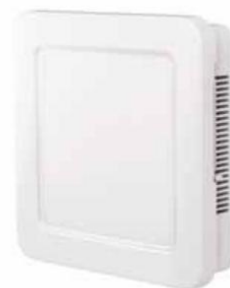
Lokální větrací jednotka Korasmar Tube 2400 (Korado) se střídáním směru proudění vzduchu, manuálně uzavíratelná klapka, vzduchový výkon od 15 do 45 m 3 /h, www.korado.cz