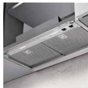
Bezmotorová vestavná digestoř Luca R (FABER) s dvoustupňovou filtrací je speciálně konstruovaná tak, aby se mohla stát součástí řízeného ventilačního systému s rekuperací, www.digestore-faber.cz